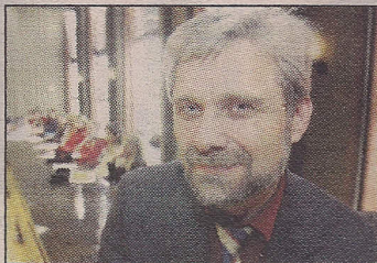
JOHNSEN: Ingen tegn til anger.

Nordli i Sørums er revet. Huset er borte, og taperen er først og fremst innbyggerne i Sørums. Det ukloke i beslutningen burde nå være gått opp for de ansvarlige, selv om Sørums ordfører viser alt annet enn anger i portrettintervjuet i RB for noen uker siden.